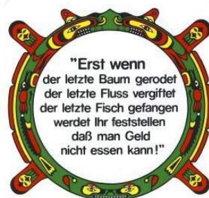
Weissagung der Cree

sterben mit dem Flächenfraß zu tun hat. Wo Gewerbe angesiedelt wird, Parkplätze und Outlets den Boden versiegeln, wächst nichts mehr und Tieren und Pflanzen wird der Lebensraum vernichtet.