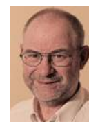
(Aus meiner Rede bei der Montagsdemo in Tübingen am 18. Juni 2018)

Solange sich die Menschen nicht zusammenschließen und demonstrieren, werden die Mieten immer weiter steigen und den Löhnen, Einkommen, Renten und den Hartz IV -Beziehern weglauten.